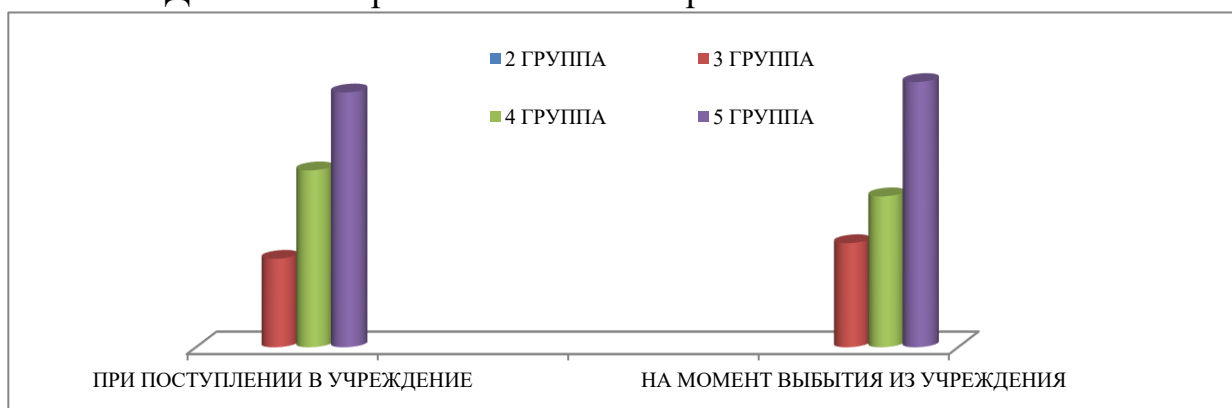
Динамика нервно-психического развития воспитанников